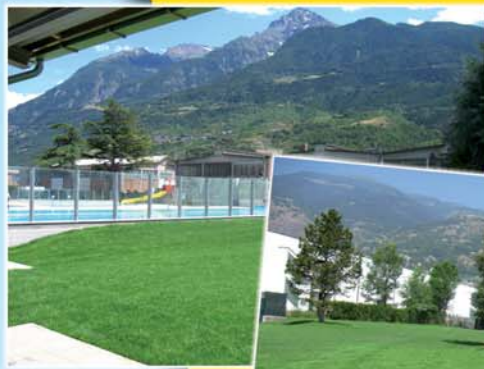
Le aree verdi