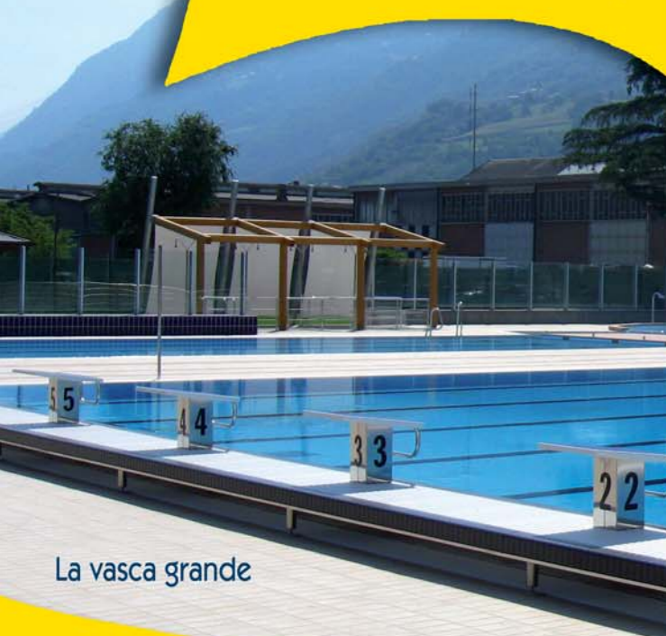
La vasca grande