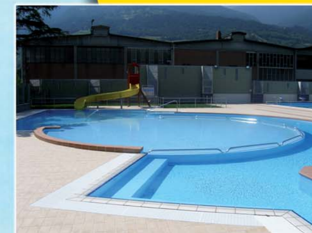
La vasca bimbi

In applicazione del regolamento comunale per la determinazione e l'applicazione dell'indicatore regionale della situazione economica equivalente (I.R.S.E.E.), all'atto dell'iscrizione verrà altresì richiesto al genitore del minore di dichiarare su apposita modulistica fornita dal Servizio sport eventuali ulteriori entrate a favore dell'utente del servizio o del beneficiario della prestazione.